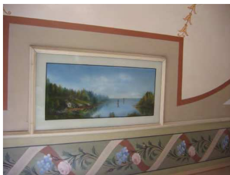
nerver och skuggor i t.ex.